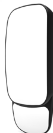
12795 / 12795E