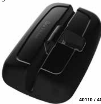
40110 / 40120