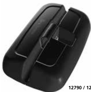
12790 / 12790E